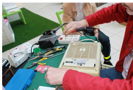
Abbildung 9: Repair-Café Veranstaltung in einem Einkaufszentrum in Graz, 2014

von den BesucherInnen selbst und auf eigenes Risiko durchgeführt. Die ehrenamtlichen Reparatur-ExpertInnen stehen nur zur Unterstützung zur Verfügung. Sollten Ersatzteile oder Verbrauchsmaterialien für die Reparatur benötigt werden, müssen diese von den BesucherInnen bezahlt werden.