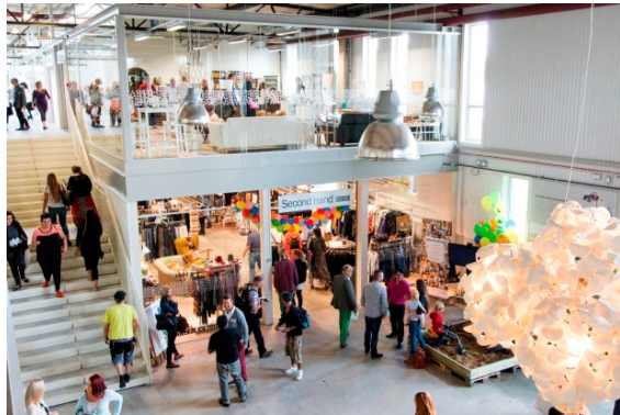
Abbildung 18: Re-Use Einkaufszentrum Återbruksgalleria

ReTuna ist das erste Re-Use- Einkaufszentrum der Welt und befindet sich in der rund 70.000 EinwohnerInnen zählenden Stadt Eskilstuna im Nordwesten Schwedens. In 14 Ladenlokalen werden ausschließlich gebrauchte und instandgesetzte oder biologisch und nachhaltig produzierte Produkte verkauft. Es ist das erste Einkaufszentrum der Welt, das ausschließlich Re-Use Ware vertreibt.