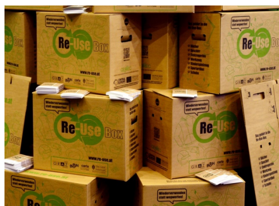
Abbildung 2: Die Grazer Re-Use Box

Zur Sammlung von mülltonnengängigen Kleinwaren wie Spielzeug, Geschirr, Werkzeug, Büchern, Sportartikeln und Schuhen wurde in Graz die Re-Use-Box als neues Sammelsystem entwickelt.