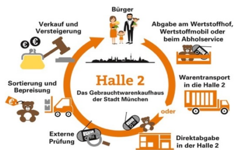
Abbildung 13: Re-Use Kreislauf der Halle 2

Die Halle 2 ist das Gebrauchtwarenkaufhaus der Stadt München. Auf 800 m 2 Verkaufsfläche bietet der städtische Betrieb Gebrauchtwaren aus den Münchner Sperrmüllhöfen an. Neben den selbst aussortierten Produkten aus der mobilen und stationären Wertstoffsammlung, gibt es auch die Möglichkeit der direkten Abgabe von re-use-fähigen Waren durch die Bevölkerung. Besonders beliebt sind die jeden Samstag organisierten Versteigerungen, bei welchen die schönsten, ausgefallensten und wertvollsten Artikel unter den Hammer kommen.