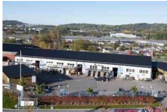
Abbildung 12: Der Re-Use Park Alelyckan

Der Re-Use Parks wird vorwiegend von der Bevölkerung von Göteborg und jener aus den Umland-Bezirken genutzt. Das sind in etwa 1 Million Menschen.