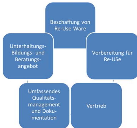
Abbildung 7: Schlüsselaktivitäten eines Re-Use Parks