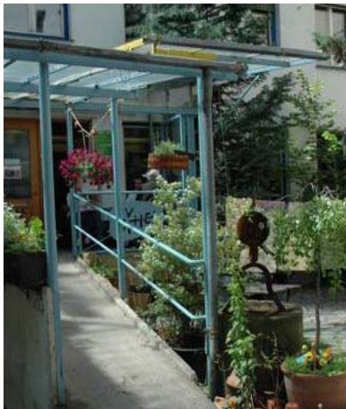
Abbildung 15: Eingangsbereich des HEi München

Das Haus der Eigenarbeit ist ein BürgerInnenzentrum mit professionell eingerichteten Werkstätten, die von allen BürgerInnen genutzt werden können, um eigene Projekte umzusetzen. Im HEi kann man: