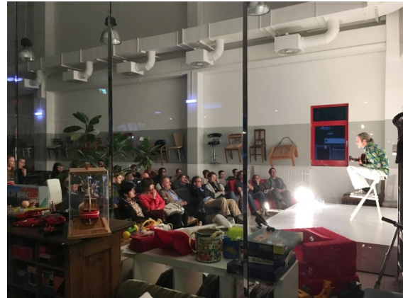
Abbildung 8: Kulturveranstaltung im BAN Re-Use Shop in Graz

Kultur ist ein adäquates Trägermedium, um bewusstseinsbildende Botschaften und Inhalte der breiten Masse „schmackhaft“ und verständlich zu machen. Auch wenn es darum geht „aufzurütteln“, sind Theaterstücke, Ausstellungen, Lesungen, Filmvorführungen etc. sehr geeignete Formen des Informations-transfers.