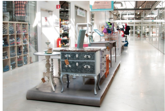
Abbildung 19: Re-Use Einkaufszentrum Återbruksgalleria.

Sensibilisierung der Bevölkerung für Nachhaltigkeit. Zu diesem Zwecke werden Workshops, Vorträge und Thementage organisiert. ReTuna beherbergt auch eine eigene Recycling-Hochschule, die eine einjährige Ausbildung zur Recycling-, Design- und Wiederwendungs-Fachkraft anbietet.