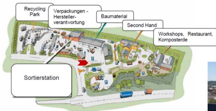
Abbildung 11: Aufbau des Re-Use Parks Alelyckan Quelle: Masterarbeit: Ebner Tina (2015) Entwicklung eines Business Modells für einen Re-Use Park © City of Gothenburg überarbeitet von Tina Ebner

Der Alelyckan Re-Use Park in Göteborg wurde auf Initiative der Stadtgemeinde im Jahr 2007 eröffnet. Der Park ist einem Wertstoff-sammelzentrum vorgeschaltet und ermutigt Personen, wiederverwendbare Gegenstände zu spenden, statt sie zu entsorgen. Bevor die zuliefernden Autos in den Recyclingpark einfahren, passieren sie den Re-Use Park, in dem alle Arten von Gebrauchtwagen gespendet werden können. Neben der Re-Use Abgabestelle beherbergt der 30.000m 2 große Park eine Sortierstelle, zwei Re-Use Geschäfte, ein Restaurant, ein Veranstaltungszentrum für Workshops im Reparatur- und Upcyclingbereich und eine Verkaufsstelle für Komposterde. Im Park werden auch zahlreiche Kulturveranstaltungen wie Lesungen, Vernissagen, Konzerte und Theateraufführungen organisiert und durchgeführt.