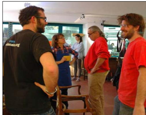
Abbildung 16: MitarbeiterInnen des HEi München.

Gängige Werkstatt-Materialien können im HEi gekauft werden, spezielle Materialwünsche bestellt das HEi zum Selbstkostenpreis für seine KlientInnen.