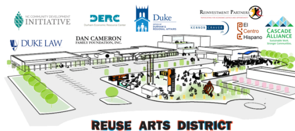
Abbildung 21: Skizze des Re-Use Art Districts in Durham

Derzeit in Planung befindet sich ein Re-Use - Abenteuerspielplatz, ein Schiffscontainer-Park, ein Skulpturenpark, eine Fahrradküche und ein Kunstatelier.