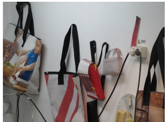
Abbildung 5: Alte Werbebanner aus Kunststoff zu neuen Taschen „upgecycelt“.

Weitere umfangreiche Beschäftigungs- und Wertschöpfungsmöglichkeiten bietet der Geschäftsbereich Upcycling. Hierbei werden aus gesammelten Altstoffen neue Gegenstände designt und hergestellt. Das bekannteste Beispiel sind Taschen aus ausrangierten LKW-Planen, Bannern und Fahnen, wie sie in zahlreichen sozialökonomischen Werkstätten fabriziert werden.