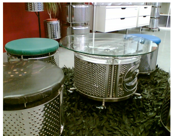
Abbildung 6: Alte Waschmaschinen-Trommeln zu Design-Hockern und Tischen „upgecycelt“.

Im Gegensatz zur Wiederverwendung ändert sich beim Upcycling zumeist die Nutzungsart des ursprünglichen Produktes bzw. Stoffes. Sozialwirtschaftliche Betriebe kombinieren häufig die beiden Geschäftsfelder Re-Use und Upcycling.