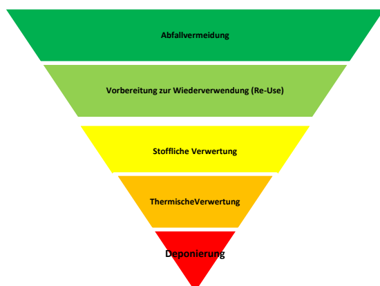
Abbildung 1: Die Europäische Abfallhierarchie

Dass die Verfügbarkeit von Rohstoffen begrenzt ist wird auch durch die Zielsetzungen der heimischen Abfallwirtschaft klar: Die Ressourcen sollen mittels Abfallvermeidung weitestgehend geschont werden, möglichst viele Stoffe dem Recycling zugeführt werden und entstehender Restabfall bestmöglich z.B. zur Wärmeerzeugung genutzt werden. Diese Zielsetzungen folgen auch der Abfallrahmenrichtlinie der Europäischen Union, welche die Maßnahmen der Abfallwirtschaft in der Abfallhierarchie neu geordnet hat.