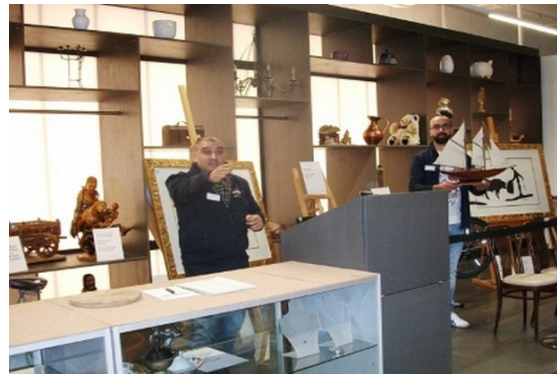
Abbildung 14: Versteigerung in der Halle 2

Neben den regelmäßigen Versteigerungen, veranstaltet die Stadt München in der Halle 2 auch Repair-Cafés. Diese sollen die Bevölkerung dabei unterstützen, sich von einer Wegwerfgesellschaft hin zu einer Reparaturgesellschaft zu entwickeln.