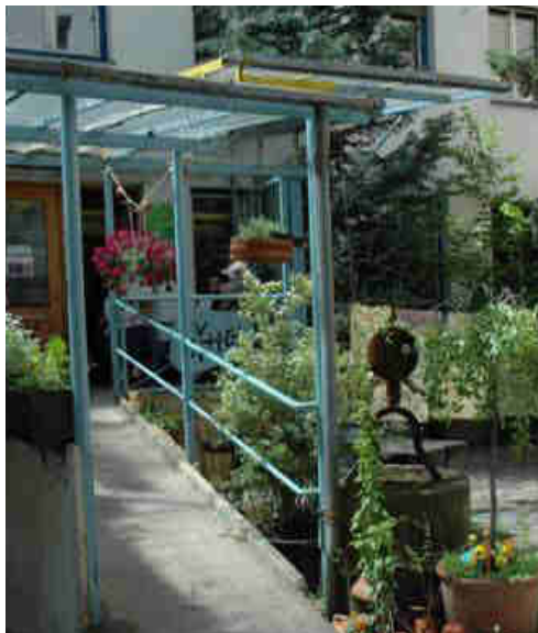
Abbildung 15: Eingangsbereich des HEi München

Das Haus der Eigenarbeit ist ein Bürger-Innenzentrum mit professionell eingerichteten Werkstätten, die von allen BürgerInnen genutzt werden können, um eigene Projekte umzusetzen. Im HEi kann man: