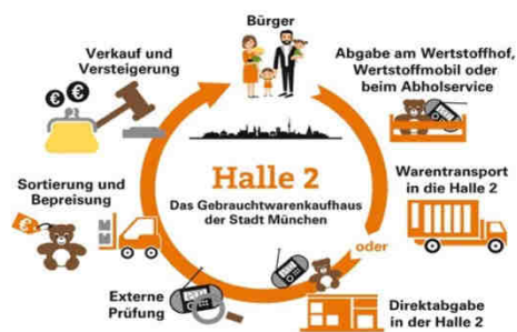
Abbildung 13: Re-Use Kreislauf der Halle 2

Die Halle 2 ist das Gebrauchtwarenkaufhaus der Stadt München. Auf 800 m 2 Verkaufsfläche bietet der städtische Betrieb Gebrauchtwaren aus den Münchner Sperrmüllhöfen an. Neben den selbst aussortierten Produkten aus der mobilen und stationären Wertstoffsammlung, gibt es auch die Möglichkeit der direkten Abgabe von re-use-fähigen Waren durch die Bevölkerung. Besonders beliebt sind die jeden Samstag organisierten Versteigerungen, bei welchen die schönsten, ausgefallensten und wertvollsten Artikel unter den Hammer kommen.