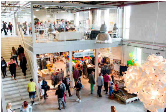
Abbildung 18: Re-Use Einkaufszentrum Återbruksgalleria

ReTuna ist das erste Re-Use- Einkaufszentrum der Welt und befindet sich in der rund 70.000 EinwohnerInnen zählenden Stadt Eskilstuna im Nordwesten Schwedens. In 14 Ladenlokalen werden ausschließlich gebrauchte und instandgesetzte oder biologisch und nachhaltig produzierte Produkte verkauft. Es ist das erste Einkaufszentrum der Welt, das ausschließlich Re-Use Ware vertreibt.