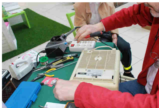
Abbildung 9: Repair-Café Veranstaltung in einem Einkaufszentrum in Graz, 2014

Risiko durchgeführt. Die ehrenamtlichen Reparatur-ExpertInnen stehen nur zur Unterstützung zur Verfügung. Sollten Ersatzteile oder Verbrauchsmaterialien für die Reparatur benötigt werden, müssen diese von den BesucherInnen bezahlt werden.