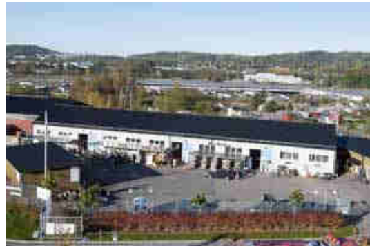
Abbildung 12: Der Re-Use Park Alelyckan

Der Re-Use Parks wird vorwiegend von der Bevölkerung von Göteborg und jener aus den Umland-Bezirken genutzt. Das sind in etwa 1 Million Menschen.