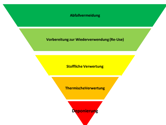
Abbildung 1: Die Europäische Abfallhierarchie

Dass die Verfügbarkeit von Rohstoffen begrenzt ist wird auch durch die Zielsetzungen der heimischen Abfallwirtschaft klar: Die Ressourcen sollen mittels Abfallvermeidung weitestgehend geschont werden, möglichst viele Stoffe dem Recycling zugeführt werden und entstehender Restabfall bestmöglich z.B. zur Wärmeerzeugung genutzt werden. Diese Zielsetzungen folgen auch der Abfallrahmenrichtlinie der Europäischen Union, welche die Maßnahmen der Abfallwirtschaft in der Abfallhierarchie neu geordnet hat.