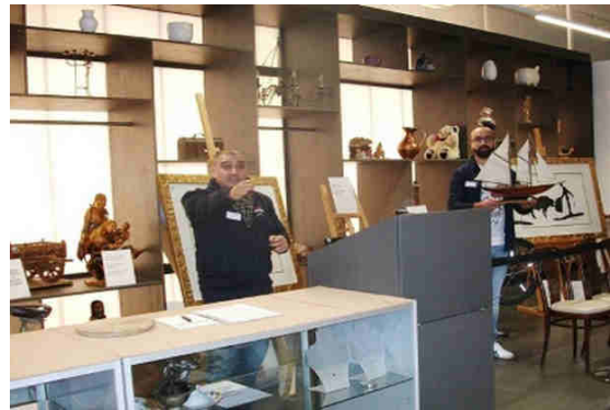
Abbildung 14: Versteigerung in der Halle 2

Neben den regelmäßigen Versteigerungen, veranstaltet die Stadt München in der Halle 2 auch Repair-Cafés. Diese sollen die Bevölkerung dabei unterstützen, sich von einer Wegwerfgesellschaft hin zu einer Reparaturgesellschaft zu entwickeln.