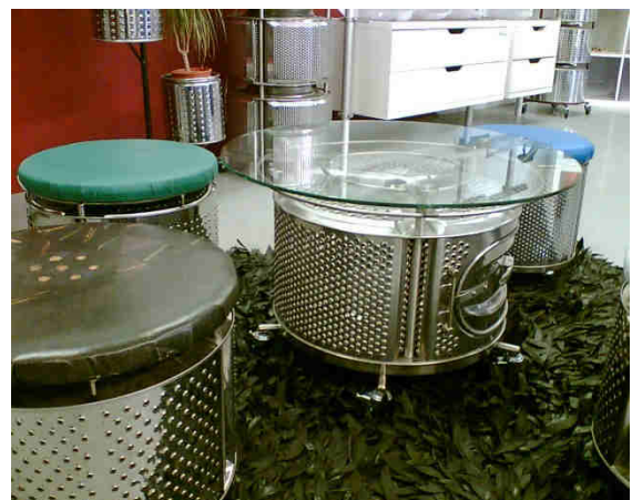
Abbildung 6: Alte Waschmaschinen-Trommeln zu Design-Hockern und Tischen „upgecycelt“.

Im Gegensatz zur Wiederverwendung ändert sich beim Upcycling zumeist die Nutzungsart des ursprünglichen Produktes bzw. Stoffes. Sozialwirtschaftliche Betriebe kombinieren häufig die beiden Geschäftsfelder Re-Use und Upcycling.