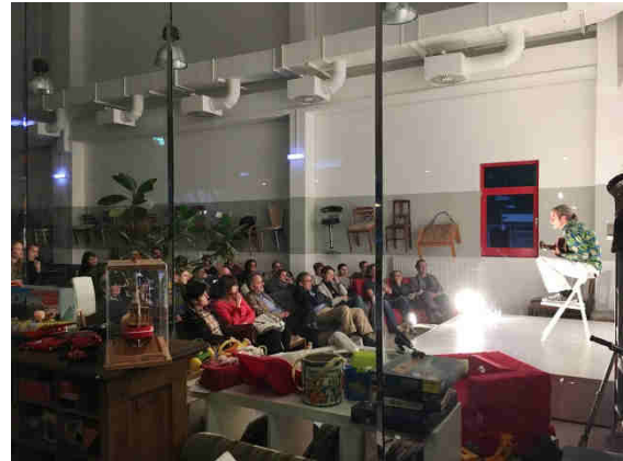
Abbildung 8: Kulturveranstaltung im BAN Re-Use Shop in Graz

Kultur ist ein adäquates Trägermedium, um bewusstseinsbildende Botschaften und Inhalte der breiten Masse „schmackhaft“ und verständlich zu machen. Auch wenn es darum geht „aufzurütteln“, sind Theaterstücke, Ausstellungen, Lesungen, Filmvorführungen etc. sehr geeignete Formen des Informations-transfers.