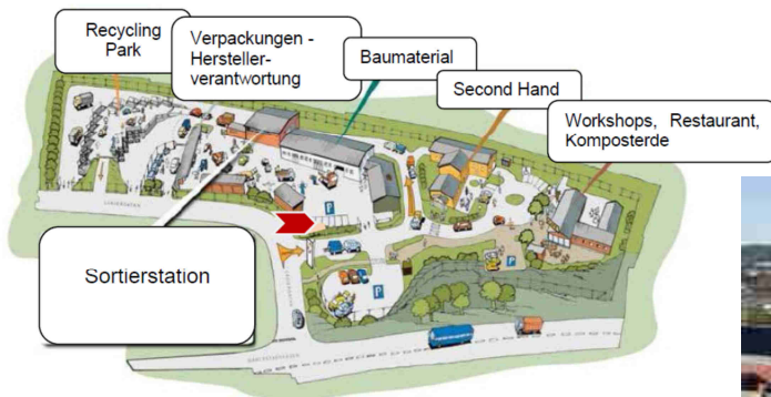
Abbildung 11: Aufbau des Re-Use Parks Alelyckan Quelle: Masterarbeit: Ebner Tina (2015) Entwicklung eines Business Modells für einen Re-Use Park © City of Gothenburg überarbeitet von Tina Ebner

Der Alelyckan Re-Use Park in Göteborg wurde auf Initiative der Stadtgemeinde im Jahr 2007 eröffnet. Der Park ist einem Wertstoff-sammelzentrum vorgeschaltet und ermutigt Personen, wiederverwendbare Gegenstände zu spenden, statt sie zu entsorgen. Bevor die zuliefernden Autos in den Recyclingpark einfahren, passieren sie den Re-Use Park, in dem alle Arten von Gebrauchtwaren gespendet werden können. Neben der Re-Use Abgabestelle beherbergt der 30.000m 2 große Park eine Sortierstelle, zwei Re-Use Geschäfte, ein Restaurant, ein Veranstaltungszentrum für Workshops im Reparatur- und Upcyclingbereich und eine Verkaufsstelle für Komposterde. Im Park werden auch zahlreiche Kulturveranstaltungen wie Lesungen, Vernissagen, Konzerte und Theateraufführungen organisiert und durchgeführt.