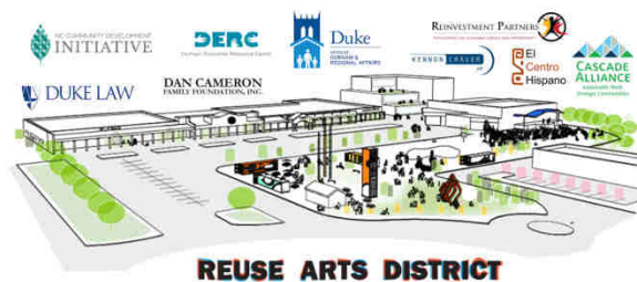
Abbildung 21: Skizze des Re-Use Art Districts in Durham

Derzeit in Planung befindet sich ein Re-Use - Abenteuerspielplatz, ein Schiffscontainer-Park, ein Skulpturenpark, eine Fahrradküche und ein Kunstatelier.