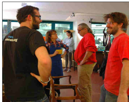
Abbildung 16: MitarbeiterInnen des HEi München.

Gängige Werkstatt-Materialien können im HEi gekauft werden, spezielle Materialwünsche bestellt das HEi zum Selbstkostenpreis für seine KlientInnen.