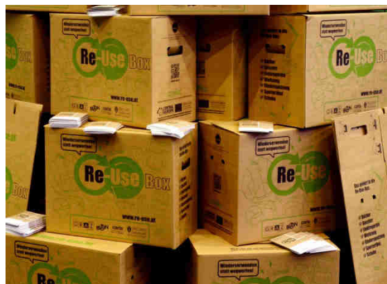
Abbildung 2: Die Grazer Re-Use Box

Zur Sammlung von mülltonnengängigen Kleinwaren wie Spielzeug, Geschirr, Werkzeug, Büchern, Sportartikeln und Schuhen wurde in Graz die Re-Use-Box als neues Sammelsystem entwickelt.