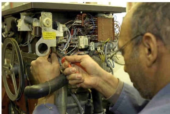
Abbildung 4: EAG Reparatur

Im Bereich von Baustoffen rechnet man mit 5 - 30 Jobs je 1.000 t Re-Use-Material, abhängig von den zur Wiederverwendung vorbereiteten Produkten und Stoffen.