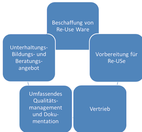
Abbildung 7: Schlüsselaktivitäten eines Re-Use Parks