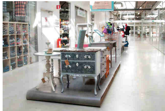
Abbildung 19: Re-Use Einkaufszentrum Återbruksgalleria.

Nachhaltigkeit. Zu diesem Zwecke werden Workshops, Vorträge und Thementage organisiert. ReTuna beherbergt auch eine eigene Recycling-Hochschule, die eine einjährige Ausbildung zur Recycling-, Design- und Wiederwendungs-Fachkraft anbietet.