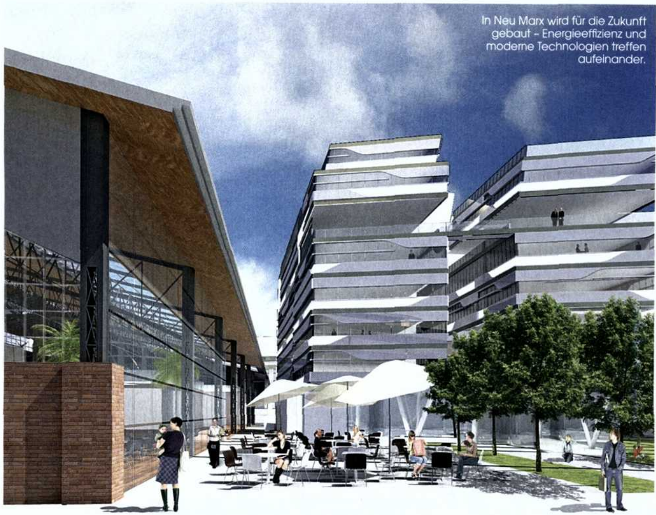
In Neu Marx wird für die Zukunft gebaut – Energieeffizienz und moderne Technologien treffen aufeinander.